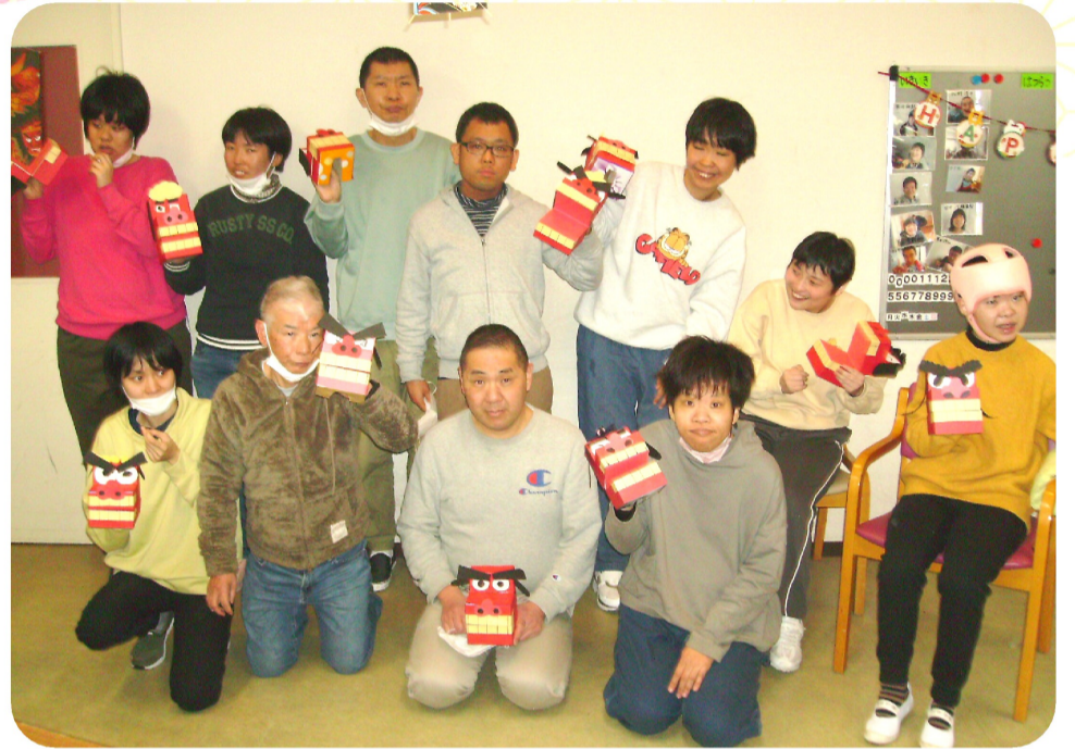
みんなで作った獅子舞と書き初めです。